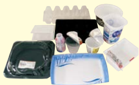
▲カップ・トレイ類