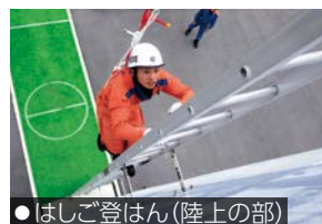
●はしご登はん(陸上の部)