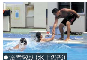
●溺者救助(水上の部)