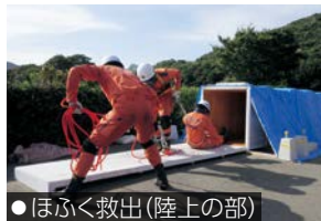
●ほふく救出(陸上の部)