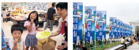
▲多彩な催しで「渥美半島田原市」をPRしました