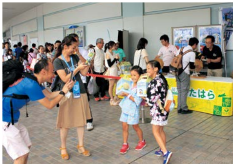
▲田原市のPRブースは大盛況!