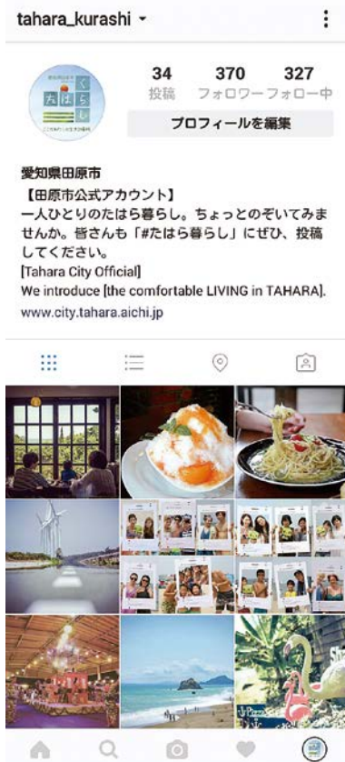
▲インスタグラム「tahara_kurashi」のホーム画面