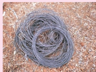
コーティングワイヤー