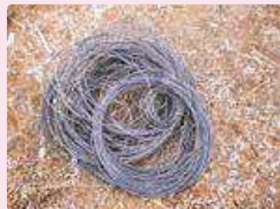
コーティングワイヤー