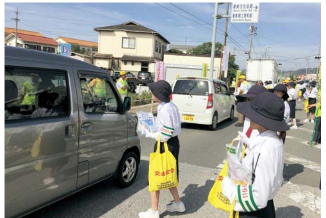
▲ドライバーに交通安全を呼びかける参加者の皆さん

夏の交通安全県民運動の一環として、街頭啓発キャンペーンが古田町の国道259号で行われました。この日は、田原市交通安全推進協議会をはじめ、市内の各種団体の皆さん約60名が、通行中のドライバーに啓発グッズやチラシを配布し、後部座席を含めたシートベルトの着用などを呼びかけました。