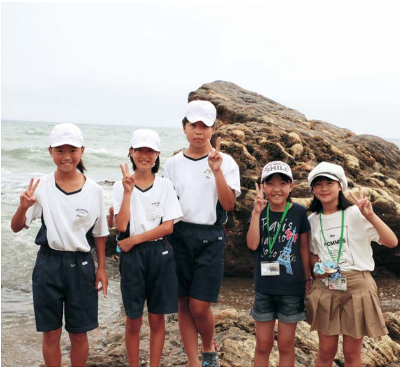
▲伊良湖岬小児童は6月に阿南町を訪問していることから、再会を喜ぶ姿もありました