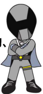
リサイクルレンジャー