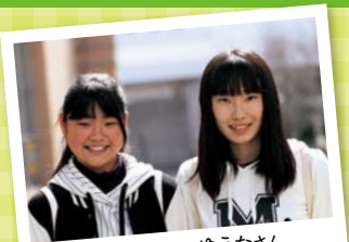
ななさん ゆうなさん みんなで神戸グラウンドに 出かけて、お花見しました!