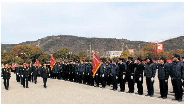
▲ 市長の観閲を受ける消防団員

はなのき広場で田原市消防団観閲式が行われ、10分団、約600名の団員が参加しました。式では、団員が市長の観閲や服装・機械器具の点検を受けました。その後、ラッパ隊吹奏訓練や部隊訓練などを行い、消防団の組織力と規律を示しました。