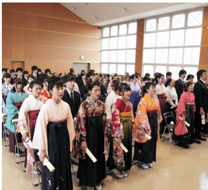
▲ 仰げば尊しを斉唱する卒業生