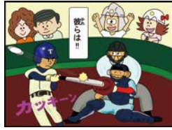
▲手書きしたものをデータ化しています