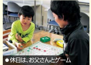
●休日は、お父さんとゲーム