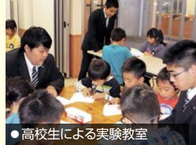
●高校生による実験教室