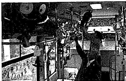
田原市のハロウィーン仕様に飾り付けられたぐるりんバス花号（豊鉄ミデイ事務所で）

バスの利用促進として、特に日頃利用の少ない幼児子ども連れが乗車するきっかけにしようという。市地域公共交通会議が10月31日のハロウィーンにちなんだ企画を初めて実施する。