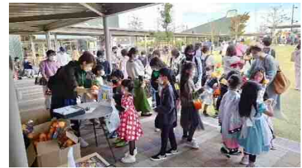
▲イベント時の配布の様子

内容：ぐるりんバスペーパークラフトの台紙「海号」・「花号」いずれか1枚[A4サイズ]、田原市公共交通ガイドブック1冊、田原市ぐるりんバス時刻表1冊、オリジナルアルコールウェットティッシュ、ぐるりん×たまぼスクラッチ大作戦チラシ、うまい棒1個をプレゼント。