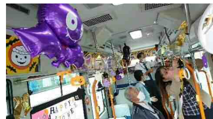
▲車内ラッピングの様子