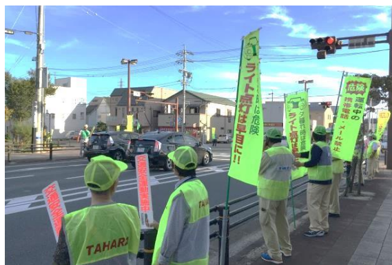
市民参加による街頭ボランティア活動