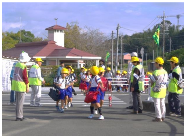
子どもの下校を見守るボランティア団体