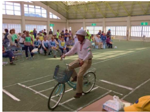
高齢者自転車大会