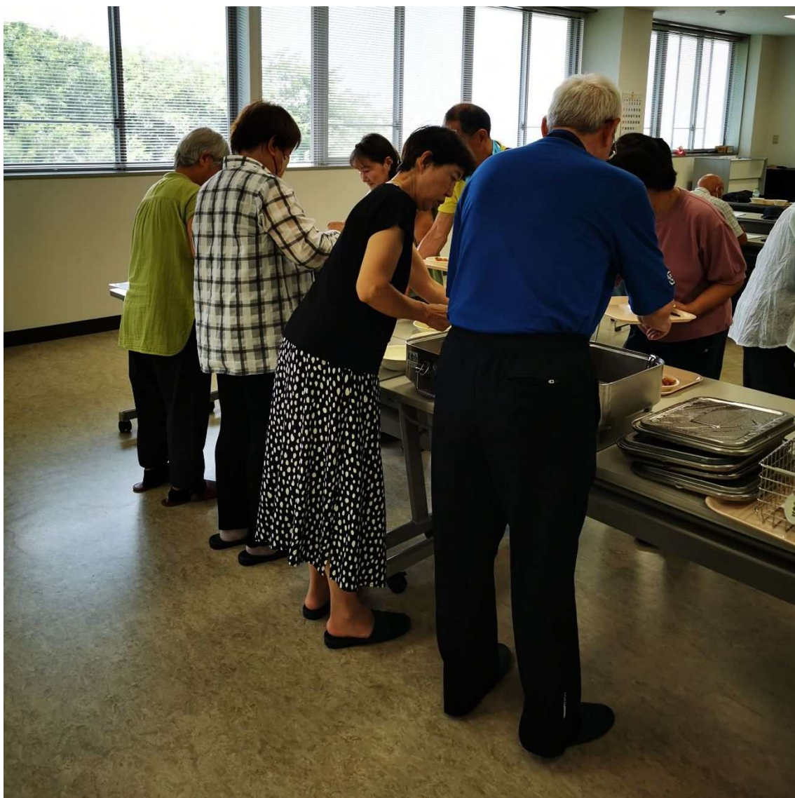
しおさい大学「おいしい給食ができるまで」講座

男女が、社会の対等な構成員として、自らの意思によって社会のあらゆる分野における活動に参画する機会が確保され、その機会が確保されることにより男女が均等に政治的、経済的、社会的及び文化的利益を享受することができ、かつ共に責任を担うことをいう。