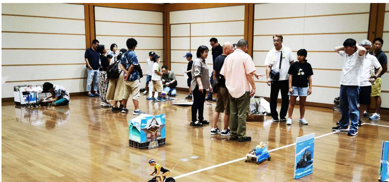
全国少年少女チャレンジ創造コンテスト地区大会

本編では「ふるさと」を主に「よりどころ」という捉え方をしていますが、「生まれ育った場所」と受け止める方も多いかと思えます。本計画では、そうした多様な受け止め方も包括して「ふるさと」という言葉を用いています。