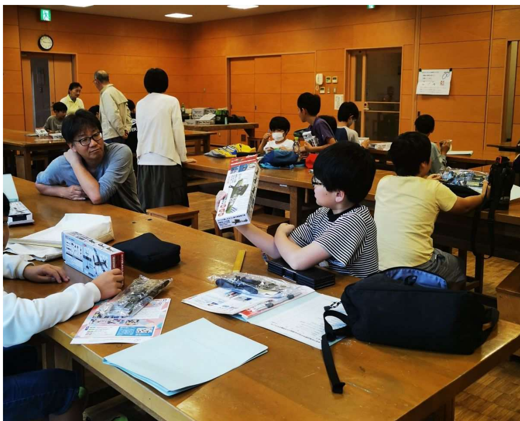
少年少女発明クラブ「ペーパークラフト」（プロペラ飛行機づくり）教室