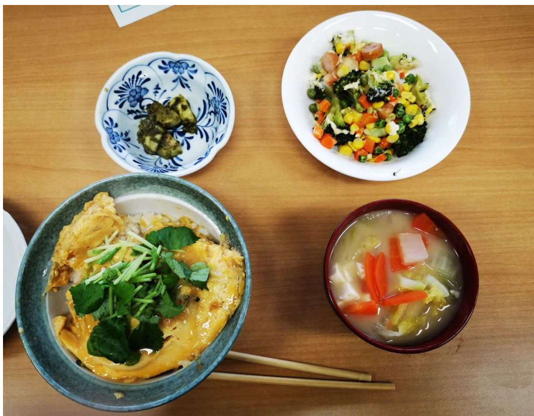
しおさい大学「季節の食材を使った料理教室」講座