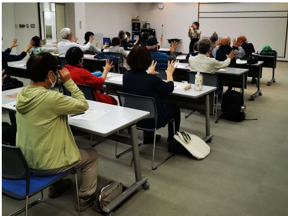
しおさい大学「脳トレで頭を活性化」講座