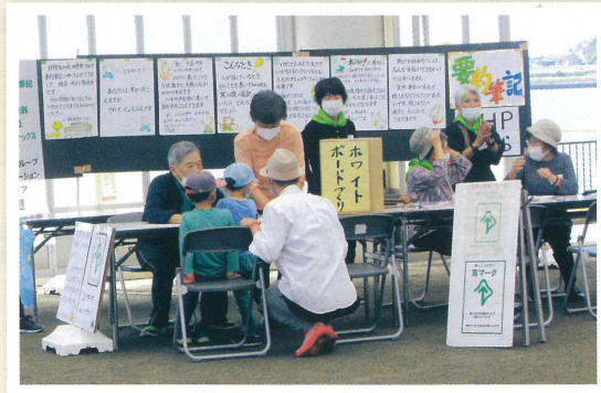
▲ブースを訪れた参加者と交流する団体

参加してくれた市民の皆さん、さまざまな市民活動に触れていただき、ありがとうございました!