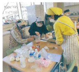
▲バッククッキングで非常食づくり