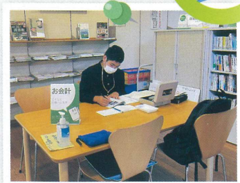
▲リサイクルブックオフィス

「NPO法人たはら広場」の活動の一つ、リサイクルブックオフィスのお手伝いもしています。図書館の除籍本などを1冊50円で販売し、その売上金を大活字本の購入資金に活用するという活動で、オフィスの開店準備と店番を手伝っています。