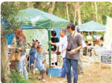
▲木々に囲まれた会場にブースが並びます

「UMINARI海鳴2015アートフェスティバル」の開催は、今年で4回目を迎えることができました。