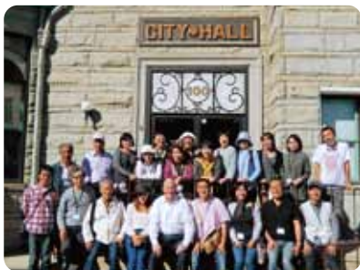
▲海外派遣 (ジョージタウン市役所にて)

たはら国際交流協会では、田原文化会館で週に2回、外国人のための「にほんご教室」を開催しています。毎回市内に住む外国の方々熱心に日本語を学んでいます。