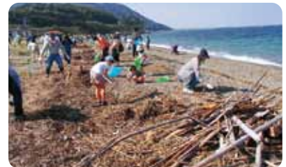
▲海岸には、流木や家庭ゴミがいっぱい

Tel 22-3515 e-mail kutsuna_ike@yahoo.co.jp