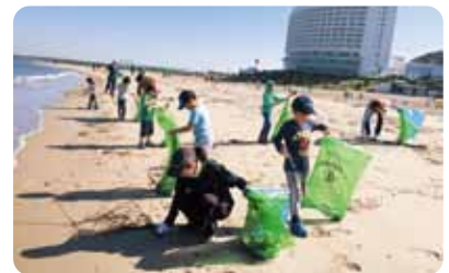
▲大人も子どもも、みんなでゴミ拾い!