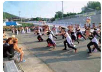
▲迫力満点のよさこい踊り