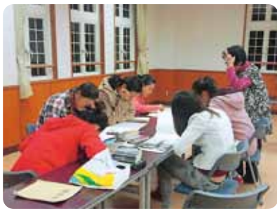
▲にほんご教室・渥美教室の様子