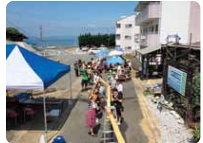
▲みんなで楽しんだ流しそうめん

☎Tel 22-3515 ☎Fax 22-7761 ✉e-mail kutsuna_ike@yahoo.co.jp