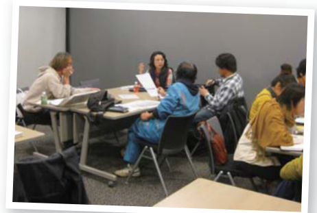
会議の様子。ティーズの取材もありました。