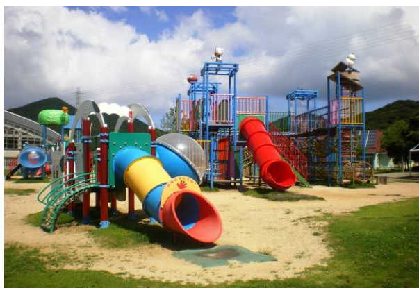
コンビネーション遊具やあひる池（右写真）もあります。この他にも芝生広場や「おもしろ自転車」の貸し出し（有料）もあります。