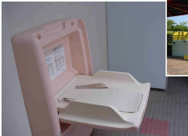
駐車場（電気機関車展示前）にある多目的トイレです。