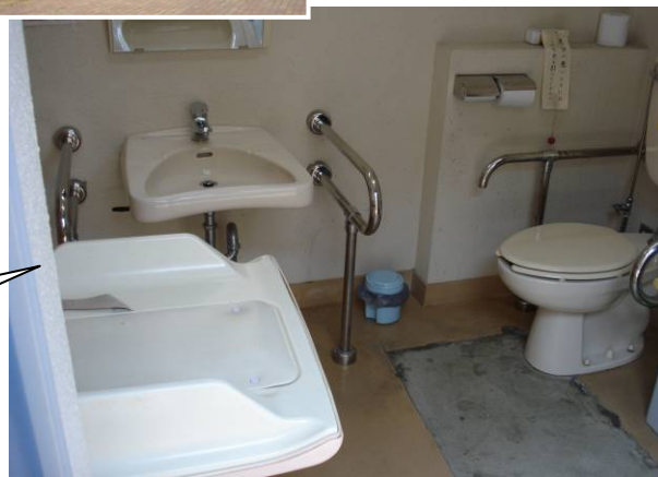
マーケット&ファーストフードコーナー裏手にある多目的トイレです。