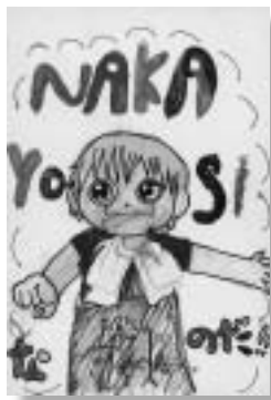
「NAKAYOSI」 はやかわゆきや 早川幸治くん(豊島)の作品