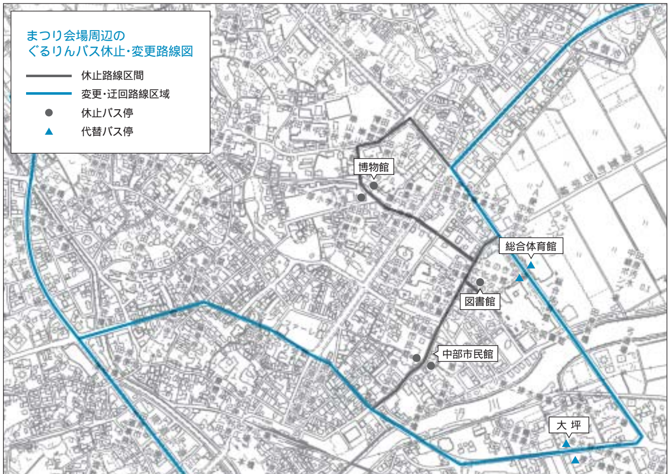
まつり会場周辺の ぐるりんバス休止・変更路線図

全路線 〓 図書館 〓 総合体育館 〓 豊鉄バスの変更はありません 総務課 ☎ 23局 3506