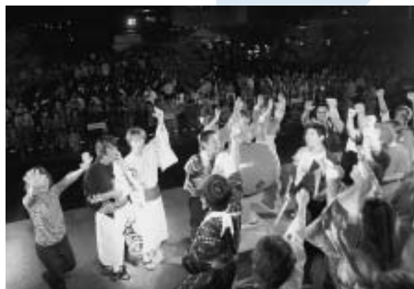
第1回田原市民まつりの一コマ(はなとき通りの総踊り)