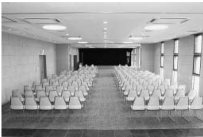
冷暖房を完備した葬儀室。いす席で約200名の会葬者を収容可能