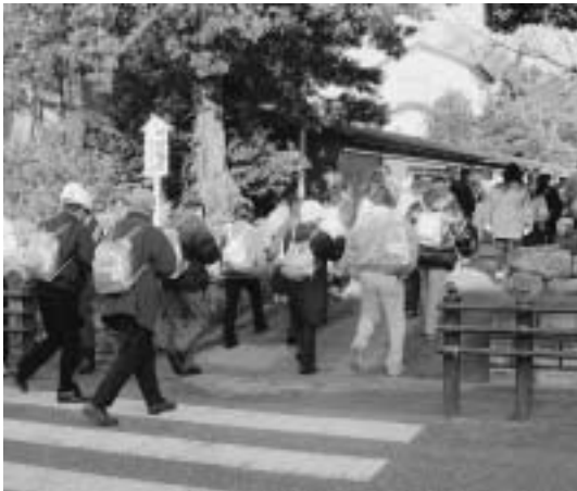
非常持出袋を背に避難所に向かう参加者の皆さん

1月18日(日)、東海・東南海地震などの大規模地震に備え、市内の全自主防災会による防災訓練を実施しました。この訓練は、予想される大規模地震が発生し避難が必要になったことを想定し、市で定めた各避難所の確認と、自主防災会や市民がとるべき行動の確認を行ったもので、消防団や市職員を含む市民約1万200人が参加しました。市民の皆さんは、非常持出袋を背に自宅から地域の避難所まで徒歩で道のりを確かめたほか、各避難所では、それぞれの自主防災会や防災リーダーによる説明会や消火訓練などが実施されるなど、地域や自分たちの役割を見つめ直す有意義な訓練となりました。今回訓練に参加できなかった方も、今後市や各自自主防災会が行う各種訓練にぜひご参加いただき、「いざ」というときのために備えましょう。