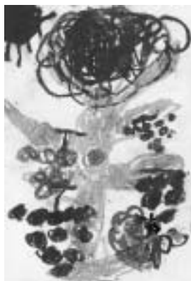
「ぶどうの木とてんとう虫」