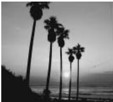
▲広報あかばね(平成15年1月号表紙の使用写真)

すてきな日の出の写真があれば、ぜひご投稿ください。このコーナーでご紹介させていただきます。今年1年、皆さんにとって良い年になりますように。(S)