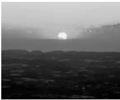
▲蔵王山展望台から見た日の出