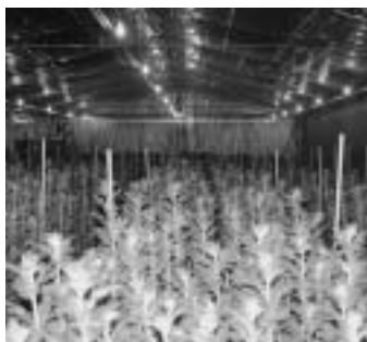
電照菊の栽培風景 温室内には、たくさんの電球がぶら下がっています。

夜、赤羽根地域を車で走っていると、都会とは違う夜景を見ることが出来ます。夜の10時を過ぎると、ガラスの城が光の帯となり、見事な夜景をつくりだしています。この光の正体は、皆さんご存じの菊の栽培による温室・ハウスの白熱電球です。