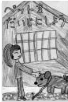
「ペットをだいにしよう」