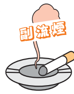
旧厚生省 喫煙と健康問題に関する報告書