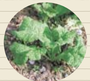
先月、種をまいた菜の花

さて、先月、子どもたちがまいた菜種ですが、ぐんぐん成長しています。やわらかい葉っぱは、おひたしなどの料理にしてすぐにも食べられます。皆さんも、ご自宅で菜の花を育ててみませんか。きれいな花が咲いたり、料理に使えたり、油を搾れたりといろいろ楽しめますよ。