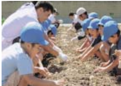
ハマユウの種植え(9月、福江町にて)

種は福江保育園の園児らと植えています。福江町にあるこの畑で育った苗が、翌年、伊良湖岬に植えられます。