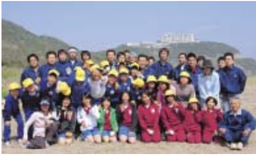
渥美青年経済研究会の皆さん(4月、恋路ヶ浜にて)

ハマユウの群生地復活を願い、今年も伊良湖小学校の児童らとともにハマユウの苗を植えました。