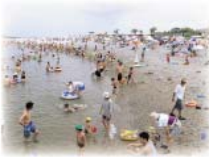
詳しくは田原市観光協会 (23局3516)まで