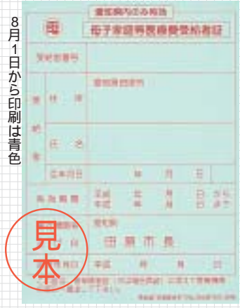
8月1日から印刷は青色