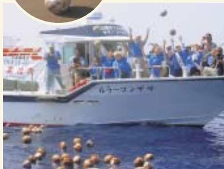
やしの実の投流の様子

伊良湖岬が舞台となった島崎藤村の「椰子の実」のロマンチックな叙情詩を再現しようと、はるか石垣島から伊良湖岬に届くよう、毎年約100個のやしの実を投流しています。平成13年の8月には、和地海岸に漂着しています。