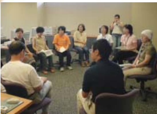
▲第2回説明会の様子(8月18日開催)