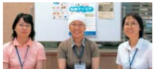
▲スタッフです。気軽に声をかけてください。