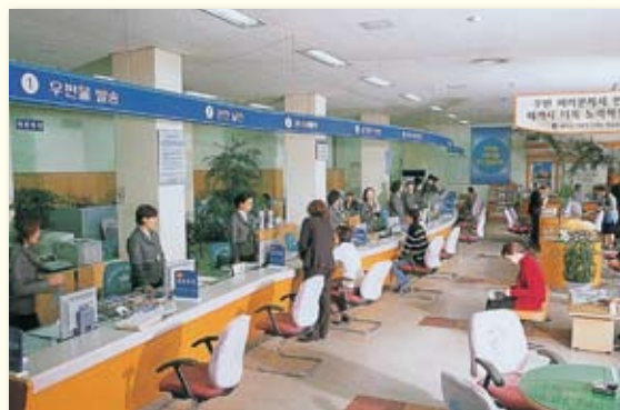
▲日本の行政機関をほうふつとさせる銅雀区庁の様子

銅雀区では区内のほとんどが住宅のため、区民の生活環境の向上と、福祉・教育の分野に力が注がれています。