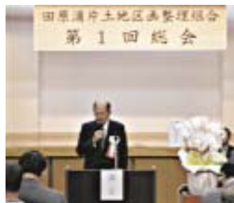
4月11日(金)の設立総会では、組合役員の選任などが審議されました。