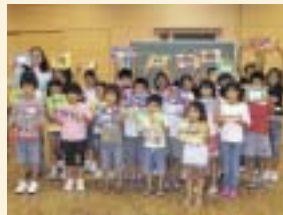
ALTによる「英語de工作」の様子

在住外国人と市民との交流を目的とした半島親睦会、市ALT(英語指導助手)との交流会、市民向け外国語教室、講演会などを実施。