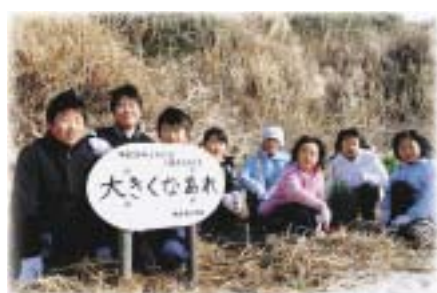
伊良湖小学校の児童らは、植樹した松の近くに、「大きくなあれ」と書いた看板を設置しました。

住民の皆さんは、冷たい潮風が吹き付け粉雪が舞う天候にも負けず、伊良湖岬灯台周辺などに「伊良湖岬を守る大きな松に育ってほしい」と願いを込めながら、一生懸命に苗を植えました。