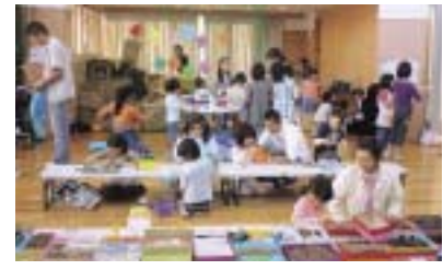
20日(日)...西部児童館のみ