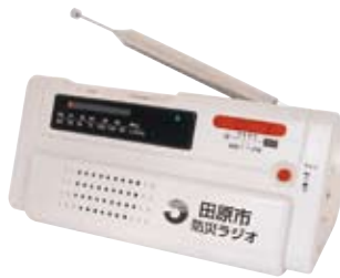
※デザインが異なる場合があります。

「こちら は、広報た はらです」 でおなじみ の同報無線 放送を、自 宅や事業所 で自動受信 できる「防災ラジオ」を販売します。