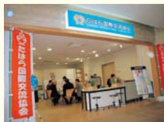
▲気軽にお立ち寄りください

現在、新会員を募集しているほか、ホストファミリーやボランティア通訳ができる方の募集も行っています。詳しくはお問い合わせください。