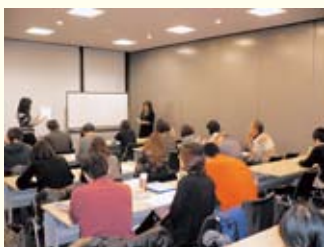
▲英会話教室の様子

中国語教室や英会話教室、外国人を対象とした日本語教室、世界の料理教室を開催するほか、市民海外派遣や外国人との交流会を実施するなど、日本人と外国人の橋渡しをする活動を行っています。