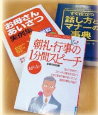
▲スピーチに役立つ書籍