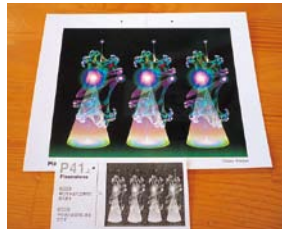
▲不思議な感覚を体験しよう!