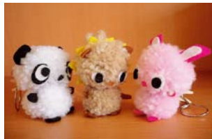
▲かわいい動物を作れるかな?