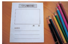
▲りっぱなウソをつけるかな?