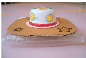
▲まどを目かけて遊んでみよう!