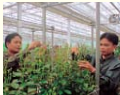
▲ 田原市内での研修の様子

平成19・20年度は、サイタニー郡農業事務所職員を2名ずつ、約4か月間にわたり研修生として受け入れ、市内の農家でバラ栽培技術や土づく