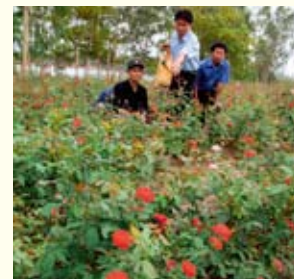
▲ 一面にバラが咲き誇る日を夢見て

帰国した研修生たちは、田原市で学んだ技術や試験栽培の経験を生かしながら、きれいなバラが咲くように今も努力を重ねています。