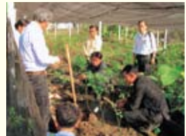
▲ サイタニー郡で栽培指導

また、平成20年度は、農業専門家を田原市からサイタニー郡に派遣し、現地でバラの定植を支援しました。そして今年度は、農業専門