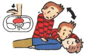
▲胸骨圧迫（心臓マッサージ）

▼対象 市内在住・在勤・在学の方 ▼日時 11月27日（日）午前9時～正午 ▼場所 渥美文化会館（農村環境改善センター） ▼定員 20名（先着順） ▼受講料 無料 ▼申し込み 11月26日（土）までに直接または電話・FAX・Eメールにて（FAX・Eメールの場合は、住所・氏名・生年月日・性別・電話番号・職業を明記） ▼その他 講習修了者に修了証を交付 ▼消防署渥美分署 ☎33局0119 FAX32局2479 atsumip@city.tahara.aich.jp