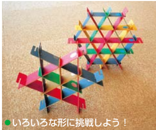
●いろいろな形に挑戦しよう!