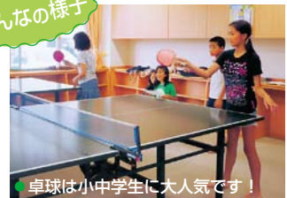
●卓球は小中学生に大人気です!

毎週土曜日の午後2時から、囲碁教室も予定しています。 ※第1土曜日のみ午後3時~