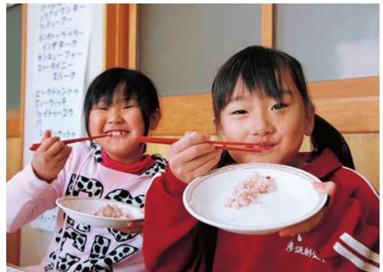
▲地産地消による食育が推進されている学校給食(写真は神戸小)

行政課題・市民ニーズに即した施策の推進および職員定数の適正化を実現するため、平成21年度に実施した機構改革およびグループ制の定着と改善に努め、組織の業務執行能力の向上を図ります。