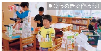
●ひらめきで作ろう!