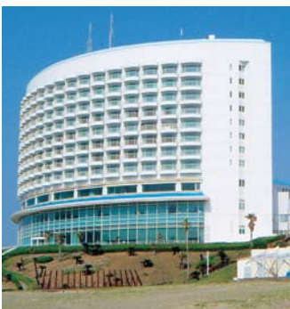
▲津波避難ビルの一つ。観光客の避難施設としても活用されます。(伊良湖シーパーク&スパ)

※津波避難ビルは、一時的な避難場所です。安全が確認された時点で、指定の避難場所へ避難してください。