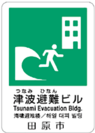
▲津波避難ビル揭示板。施設の玄関付近などに設置されています。

今後は、市内の中心市街地などをはじめ、緊急避難場所として適した津波避難ビルの拡充を図っていく予定です。