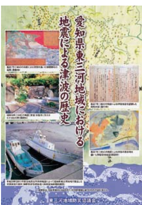
▲東三河津波歴史パンフレット

なお、パンフレットについては、今月号の広報たはらと併せて、各世帯に配布しています。