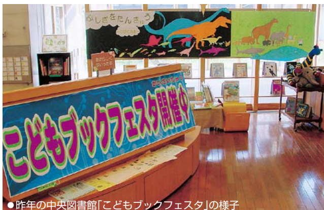
●昨年の中央図書館「こどもブックフェスタ」の様子